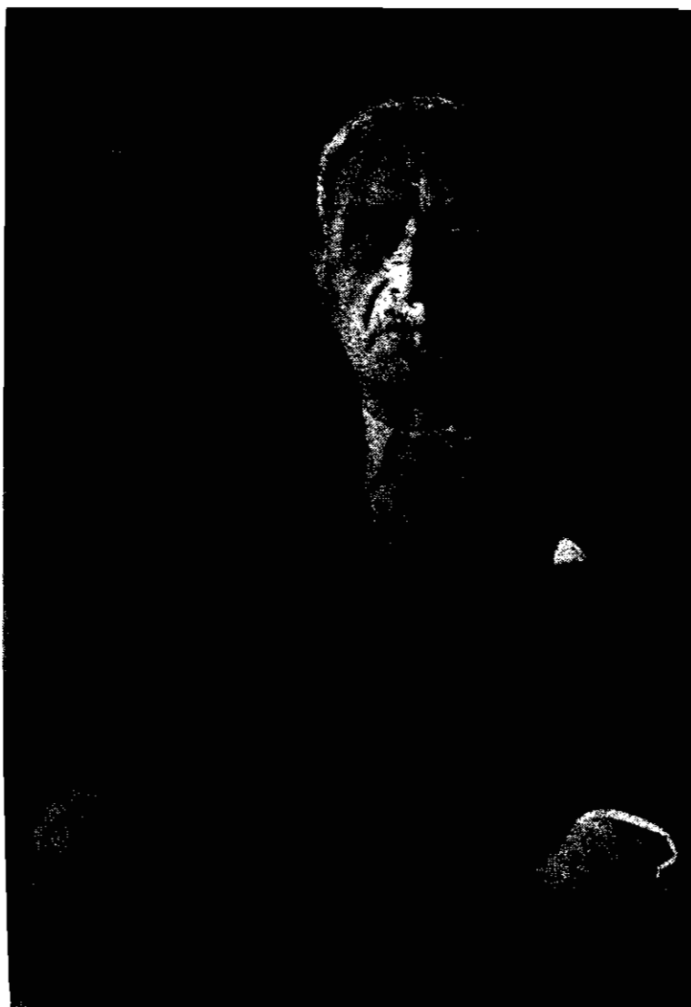
استاد ابراهیم پورداود

رشت، پانزدهم اسفندماه ۱۲۶۴ — تهران، بیست و هفتم آبان ماه ۱۳۴۷ خورشیدی